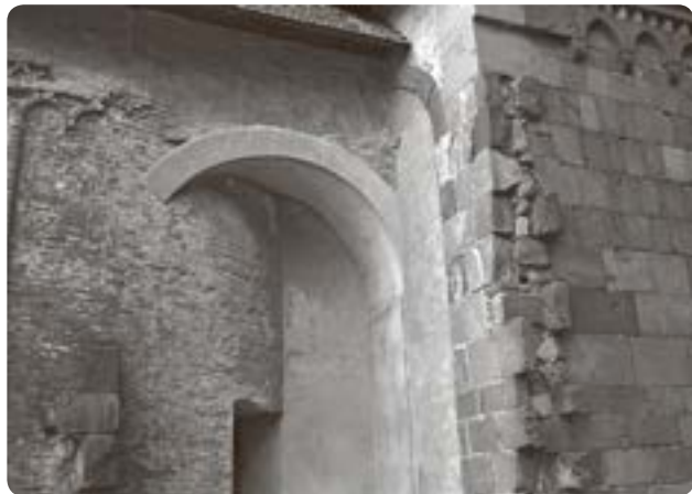
A karcasai Árpád-kori templom ősi falai