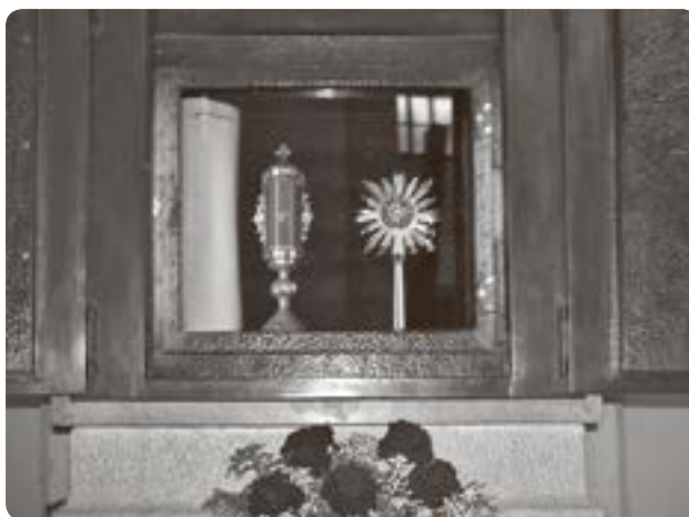
Szent Erzsébet ereklyéi a sárospataki Vártemplomban