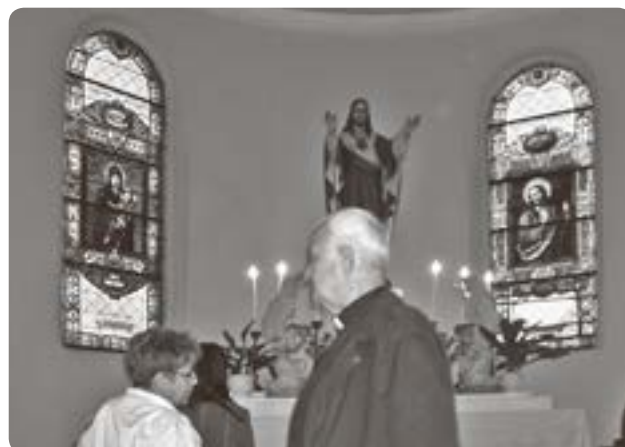
A Jézus Szíve templom belseje és festett üveglakalai