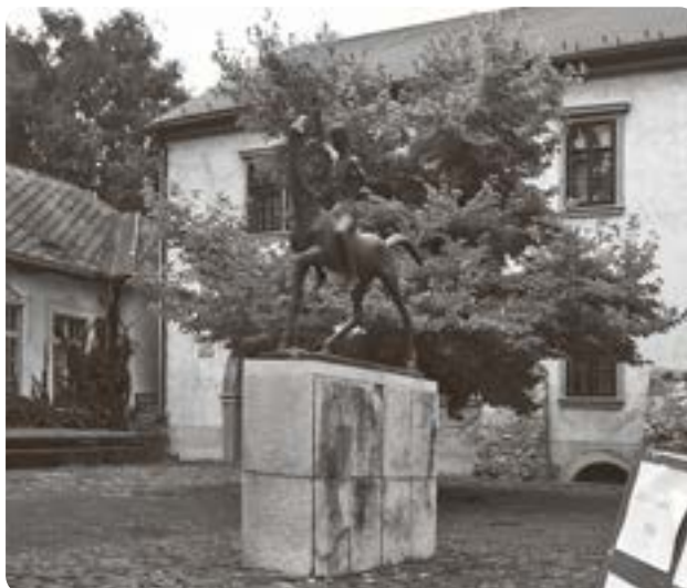
A sárospataki vármúzeum

Utunk utolsó állomása Sárospatak volt, Árpád-házi Szent Erzsébetünk szülővárosa. Elsőként az „ő templomát” kerestük fel. Ez a katolikus plébánia-templom. Vártemplom néven is ismert. A mai impozáns «basilica minor» helyén is egy körtemplom állt 1047 tájáról. (Ennek falai a templom déli oldalán ma is láthatóak.) A XVI. században a török elleni védelemül falait megerősítették. Volt református templom is, majd Báthory Zsófia adta vissza a katolikusoknak. Mikor 1783-ban kiképezték dongaboltozatát, hiba csúszott az építkezésbe, így a szentély felőli oszlopok ma 15–18 cm dőlést mutatnak. Ebből az időből származik mai tornya is. Főoltára Szűz Mária mennybevételét ábrázolja. A templom egyik