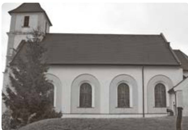
A pácini római katolikus templom

A Bodroghöz a zempléni Hegyaljától keletre, a Bodrog, a Tisza és a Latorca folyók által körülölelt terület. Északi része ma Szlovákiához tartozik. A feltárt régészeti leletek (honfoglalás-kori sírok) tanúsága szerint honfoglaló őseink is szerették ezt a tájat, szívesen laktak itt. A nép őrzi ősei meséit, legendáit, és tiszteli, ápolja történelmi hagyományait. Ezt tapasztaltuk utunk első állomáshelyén, Páciban is.