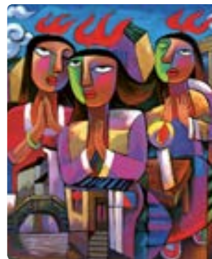
He 01: A Szentlélek eljövetele