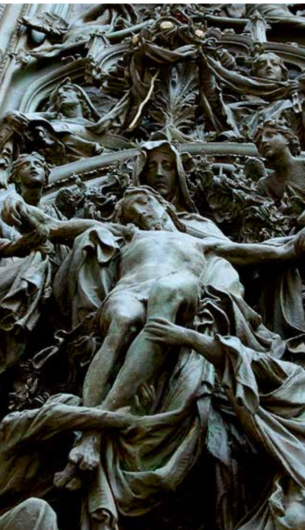
Dombormű részlet a milánói dóm kapuzatán

Emlékezz ember, hogy porból vagy és porrá leszel