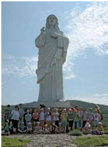
A debreceni Szent Anna Főplébánia hitoktatóinak táboroztatási munkacsoportja

Örömteli meglepedésünkre sok szép élménnyel gazdagodtunk és jól használtuk fel testi-lelki erőnlétünket, valamint a nap további ajándékait is. Növekedtünk a teremtett és épített világ megbecsülésében, valamint Isten és egymás szeretetében.