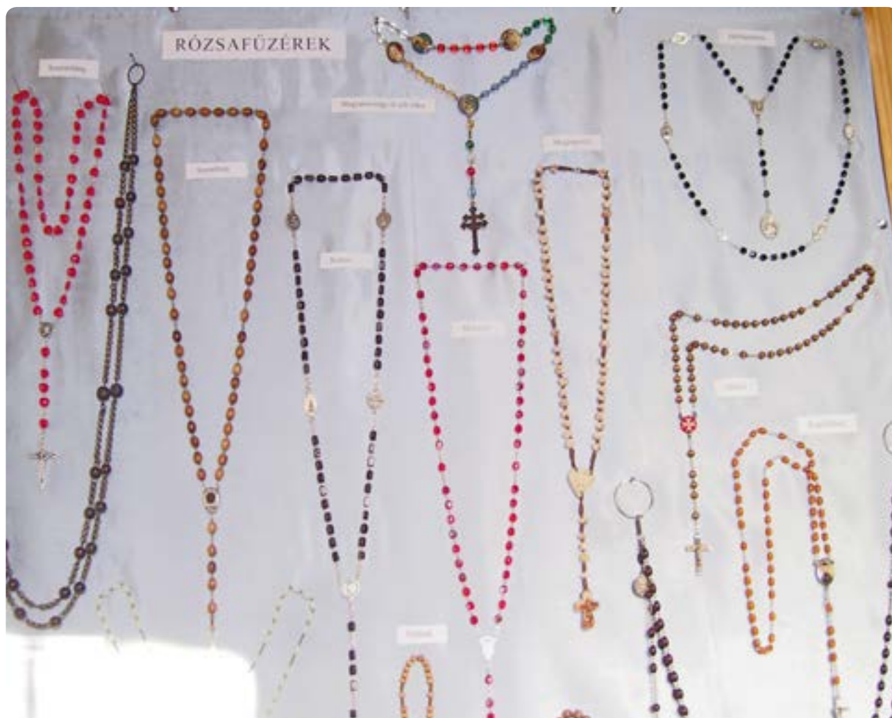
Fenn, középen a magyarság öt-seb-titka rózsafüzér

azért, hogy van-e rajtuk feszület vagy csak érmék, hogy milyenek a szemei, még az sem, hogy egy-egy „tized” három, öt, esetleg hét Üdvözlégyet tartalmaz egyik „nagyszemtől” a másikig. Azt hiszem, specialitásuk attól függ, hogy elsősorban kihez/mihez fohászunk bennük, kinek/minek a tiszteletére mondjuk az imát, miben kérjük a „névadó” segítségét. Sok ilyen speciális rózsafüzér létezik. A kiállításon is látható például a Hét fájdalmú Szűzanya rózsafüzére , melynek keresztjén a szent Fia keresztje tövében álló Mária is ott van, Szent Rita-, Pio atya vagy A magyarság öt-seb-titka rózsafüzér . Ez utóbbiról néhány szó.